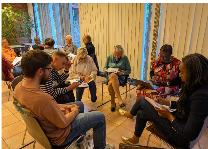
Légende: Les participants ont travaillé en groupes, expérimentant la conversation dans l'Esprit.