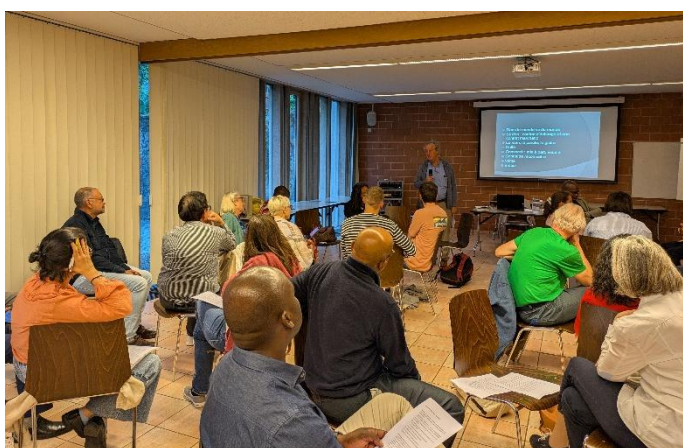
Légende: Les travaux se sont déroulés dans une ambiance agréable et une complicité entre l'animateur et les participants.