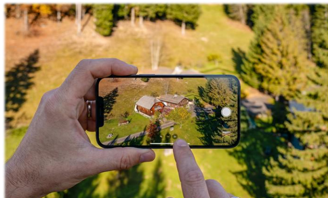
La chapelle Notre-Dame des Neiges à Plans-sur-Bex est une belle idée d'escapade pour visiter les Alpes vaudoises

Italie, France, Grèce, Espagne ou destinations plus lointaines: n'hésitez pas à nous envoyer une photo accompagnée d'une légende précisant le lieu, la date et le nom de l'église visitée à info@cath-vaud.ch . Nous nous