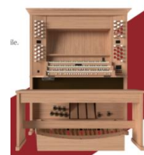
Brochure parrainage Formulaire de don

Le formulaire de promesse de don se trouve dans la brochure dédiée à ce projet, disponible à l'église et avec ce code QR = >