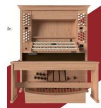
Brochure parrainage Formulaire de don

Le formulaire de promesse de don se trouve dans la brochure dédiée à ce projet, disponible à l'église et avec ce code QR = >