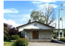
Ste Marie- Madelei