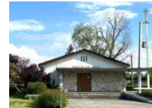
Ste Marie- Madelei