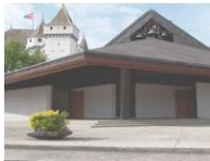
Notre-Dame de l'Immaculée Conception