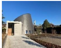
St Jean Baptiste