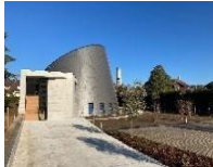
St Jean Baptiste