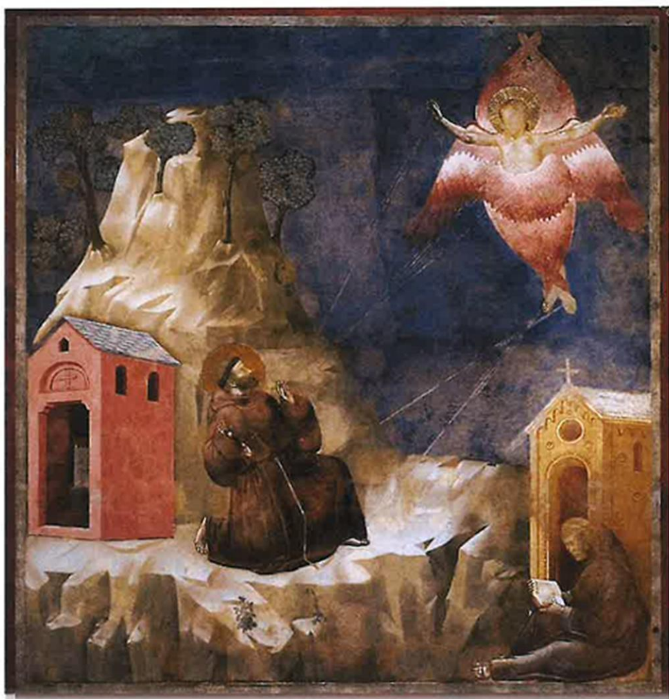
Saint François d'Assise recevant les stigmates.