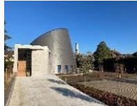
St Jean Baptiste