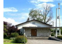
Ste Marie- Madelei