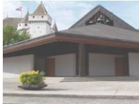
Notre-Dame de l'Immaculée Conception