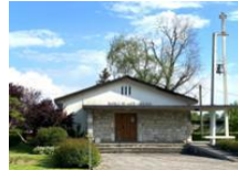
Ste Marie- Madelei