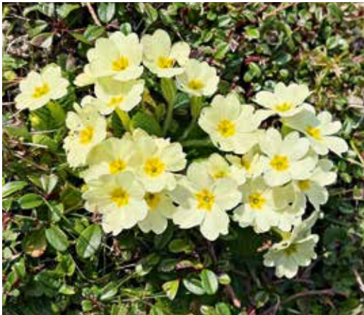
Primeln im Frühling