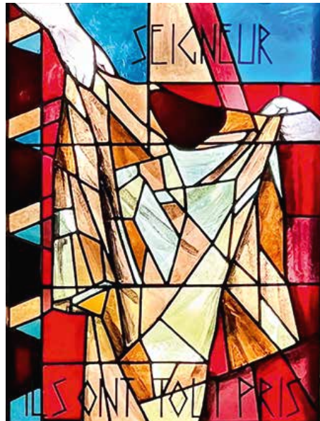
Glasfenster der Kapelle «La Pelouse» Oberhalb von Bex bei den Schwestern der Kongregation «Saint Maurice» an unserem letztjährigen Pfarreiausflug