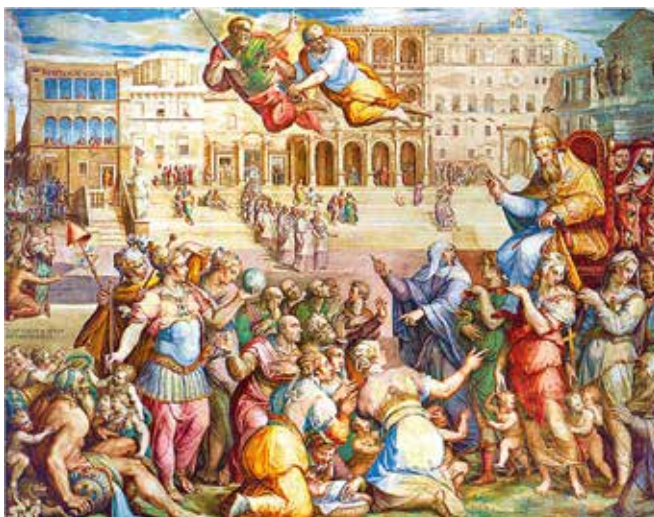
Katharina führt Papst Gregor XI. von Avignon zurück nach Rom