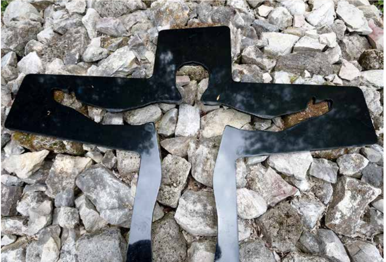
Segenskreuz von Martin Burchard, Besinnungsweg Ehinger Alb

53. Jahrgang, Nr. 2 – erscheint 4 Mal im Jahr