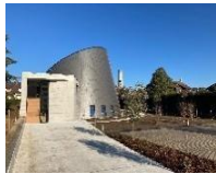
St Jean Baptiste