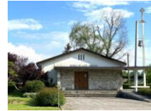
Ste Marie- Madeleine