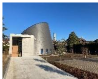
St Jean Baptiste