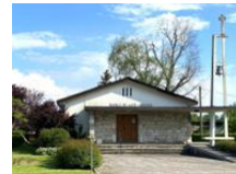
Ste Marie- Madeleine