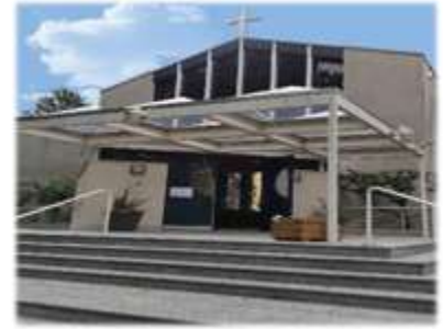
Paroisse de St-Joseph avenue de Morges 66 1004 Lausanne +41 (0)21 624 45 55 paroisse.lausanne.st-joseph@cath-vd.ch