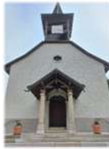
Communauté du Haut messes à l'église de Cheseaux secrétariat : ch. du Village 9 1032 Romanel-sur-Lausanne communautcatholique@bluewin.ch