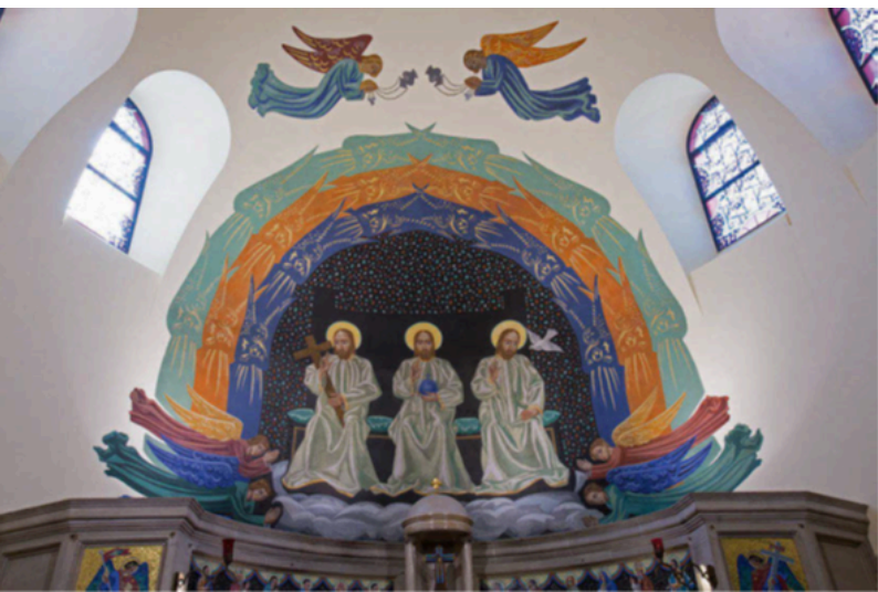
Peinture murale de Gino Severini, Semsales (FR)

Nous leur devons la création ou la rénovation d'une centaine d'églises en l'espace de vingt ans en Suisse Romande.