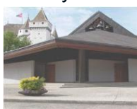
Notre-Dame de l'Immaculée Conception