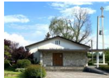
Ste Marie- Madeleine