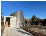
St Jean Baptiste