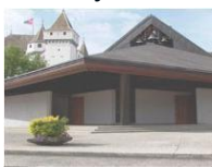
Notre-Dame de l'Immaculée Conception