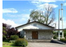
Ste Marie- Madeleine