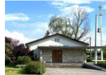
Ste Marie- Madeleine