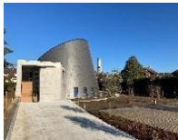
St Jean Baptiste