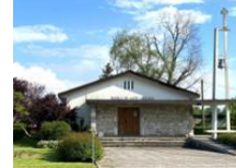
Ste Marie- Madeleine