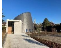
St Jean Baptiste