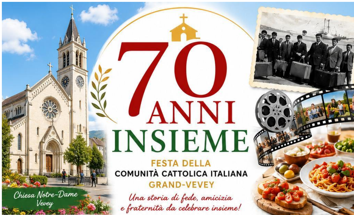
Chiesa Notre-Dame Vevey