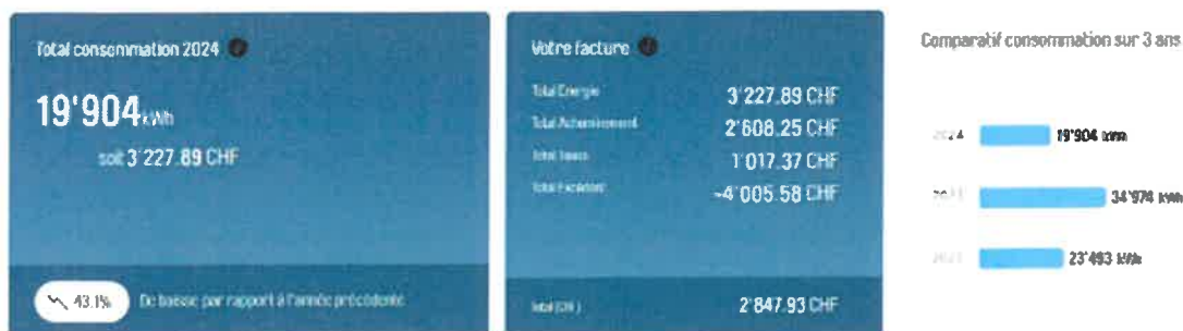
Consommation 2024: Répartition par sites