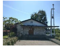
Ste Marie- Madeleine