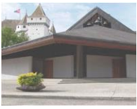
N.-D. de l'Immaculée Conception