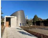
St Jean Baptiste