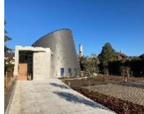
St Jean Baptiste