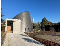
St Jean Baptiste