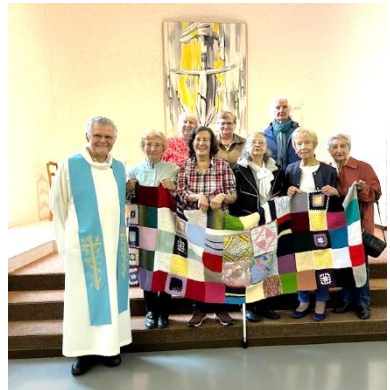
Groupe MCR Sainte-Croix

Si nous avons réussi à réunir, unir, mettre ensemble différents carrés et faire une couverture protectrice, chauffante, alors de même, osons aller vers l'autre et unis par le fil de la foi et l'espérance vivons ensemble la vie que Dieu nous donne.