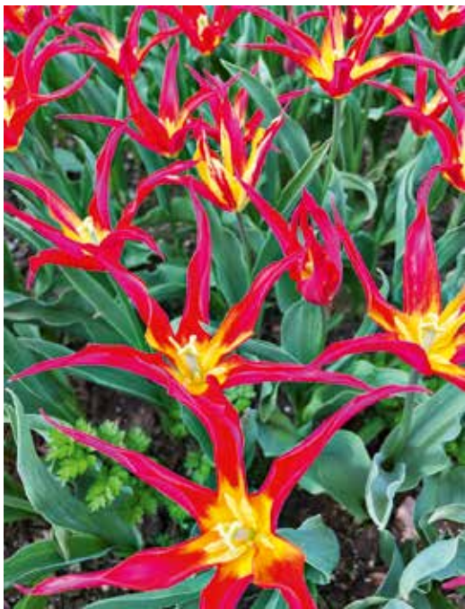
Besondere Tulpenart