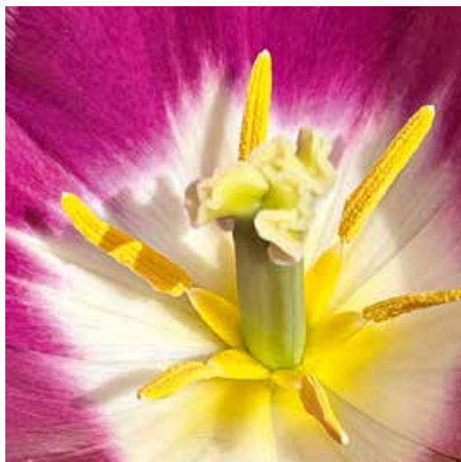
Tulpe, Wunderwerk der Natur