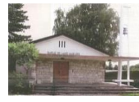
Ste Marie- Madeleine