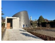
St Jean Baptiste