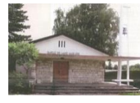
Ste Marie- Madeleine