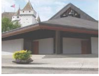
N.-D. de l'Immaculée Conception