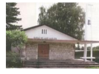
Ste Marie- Madeleine