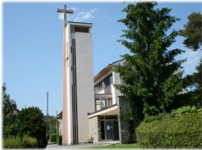
Paroisse du Bon Pasteur

Av. des Cerisiers 2 1008 Prilly +41 (0)21 634 92 14