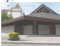
N.-D. de l'Immaculée Conception