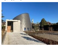
St Jean Baptiste