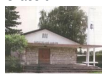
Ste Marie- Madeleine