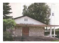
Ste Marie- Madeleine