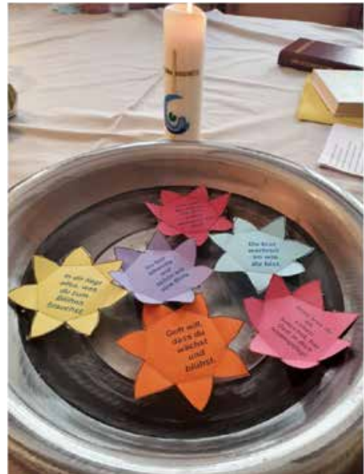
Papierrosen

Papst Benedikt erklärte dies ganz schlicht, indem er sagte, dass die christliche Gemeinde sich durch «Anziehung» entwickle (vgl. seine Predigt in der Eucharistiefeier zur Eröffnung der V. Generalversammlung der Bischöfe von Lateinamerika und der Karibik , Aparecida, 13. Mai 2007), das heisst durch das gute Beispiel der Gläubigen. Inwiefern? Indem Christen sich vom Geist Christi inspirieren lassen und mit ihrem Wirken die Herzen anderer Menschen berühren.