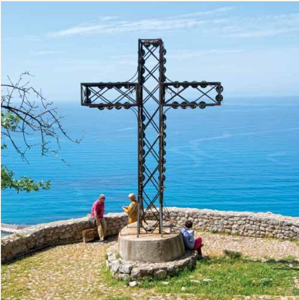
Burgberg Rocca di Cefalù

51. Jahrgang, Nr. 2 – erscheint 4 Mal im Jahr