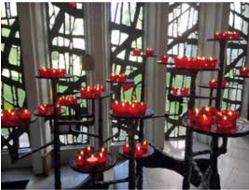
Kerzenlichter und Fenster der Autobahnkapelle von Altorf (Uri)