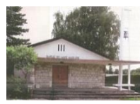
Ste Marie- Madeleine