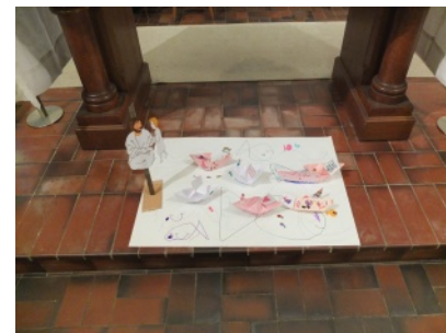
Le bricolage réalisé par les enfants