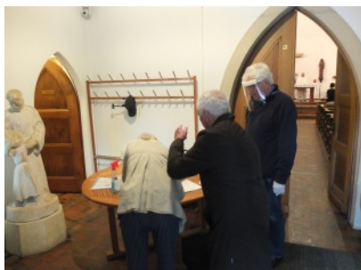
Les gens se sont pliés de bonne grâce à l'obligation de donner leurs coordonnées avant chaque cérémonie