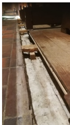
Chauffage des bancs