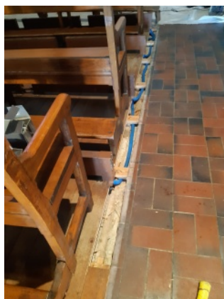
Les câbles alimentant les radiateurs