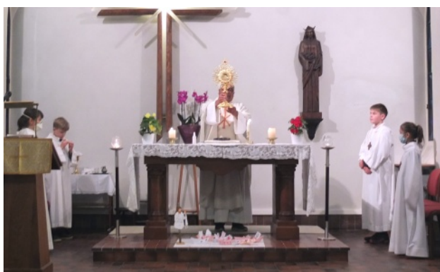
Nous avons pu contempler l'Ostensoir de notre Communauté, très peu utilisé.

En raison des mesures sanitaires à respecter, il a fallu, pour chaque cérémonie, trouver des bonnes volontés: