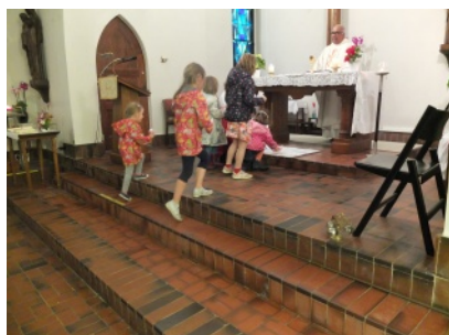
Les enfants déposent leurs oeuvres