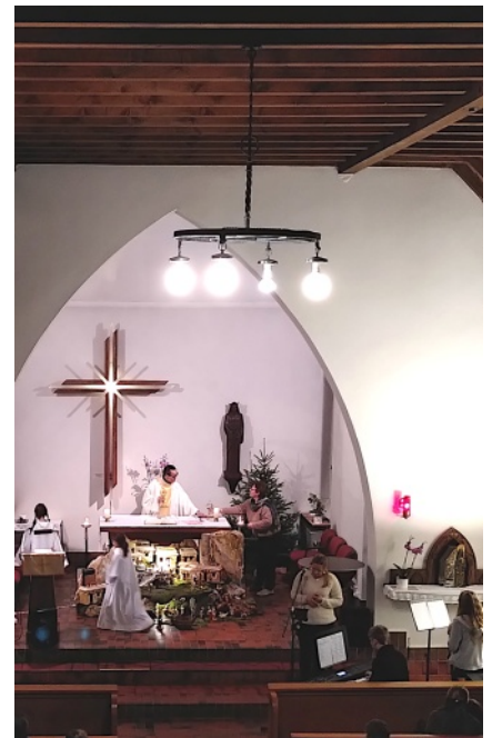
Le lustre, haut perché et difficile d'accès