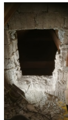
Passage sur les combles