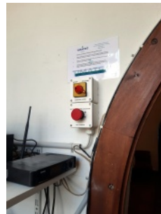
L'interrupteur du treuil