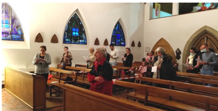
Tous les participants avaient reçu une feuille avec les intentions. Ils étaient invités à en lire une à tour de rôle.