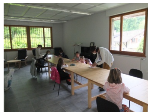
Salle de l'ancienne poste à St-cergue

Juste après l'homélie, les enfants ont déposé le fruit de leur travail et de leurs réflexions au pied de l'autel. Ils se sont réunis autour de l'autel mais sans mimer le Notre Père en compagnie de quelques adultes comme d'habitude, en raison des mesures sanitaires. Pour la même raison, les musiciens se sont produits depuis la galerie.