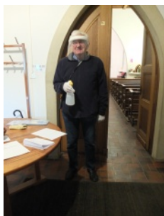
Désinfection à l'entrée