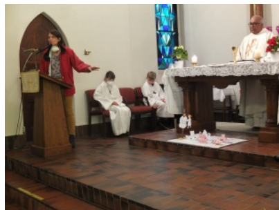
Explication du travail des enfants