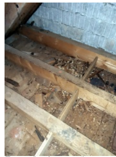
Trappe d'accès au treuil

Merci à ces entreprises qui ont parfaitement travaillé, sans perturber les cérémonies qui avaient lieu durant cette période. Comme il fallait, pour remplacer les câbles, accéder à l'espace entre le plafond de la chapelle et le toit, nous en avons profité, pour y installer un treuil permettant de descendre le lustre surplombant la nef et difficile d'accès, afin d'éviter à l'avenir de faire appel à une société pour changer les ampoules. Les travaux ont finalement duré 4 mois et se sont achevés au mois de mai avec une facture de CHF 20'432.65. Mais, si on ose le dire, au diable les finances ! Tout est désormais 'propre en ordre'. Nous sommes à l'abri des surcharges et des courts-circuits pour les années à venir. Enfin ... si Dieu le veut !