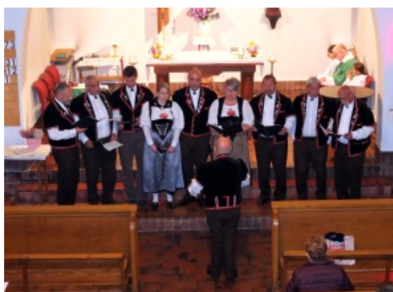
Des chanteurs encore pleins d'énergie durant la messe, malgré les longues heures passées à parcourir les rues en fête de Saint-Cergue depuis le matin ...