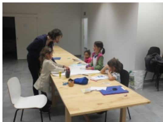
Une rencontre "Parents enfants" a eu lieu avant la messe