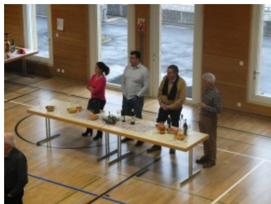
La Municipalité était invitée et s'est fait un plaisir de servir l'apéritif.