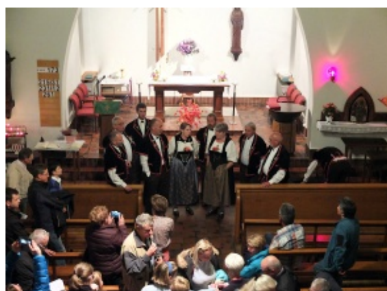
... ainsi que pendant la veillée. Grand merci !