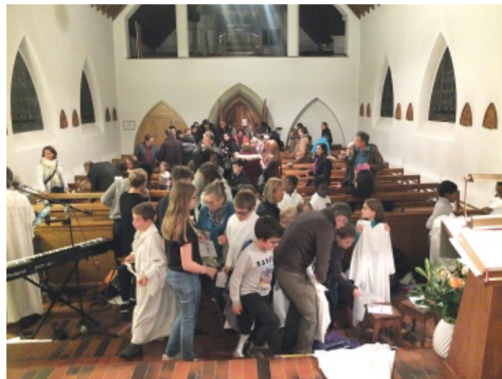
Rangement et verre de l'amitié dans un joyeux désordre !