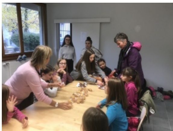
Dans la salle de l'ancienne poste à Saint-Cergue