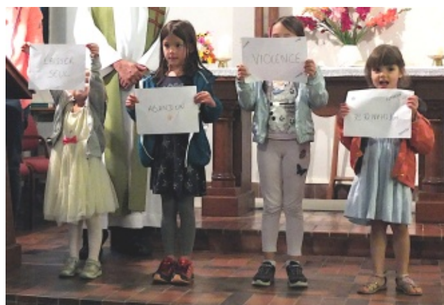
Les thèmes abordés durant l'atelier : laisser seul, abandon, violence, méchanceté