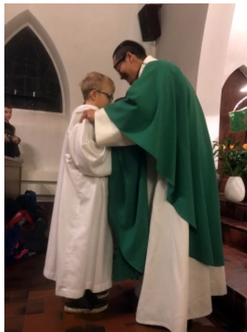
Les nouveaux servants reçoivent leur aube.

Au total, ce sont 83 personnes qui ont participé à la cérémonie et à la verrée qui a suivi.