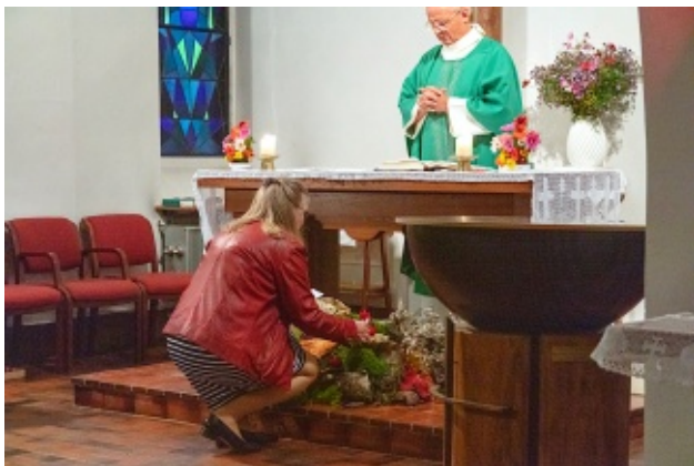
Une bougie allumée pour chaque disparu

Texte : M. Pannatier