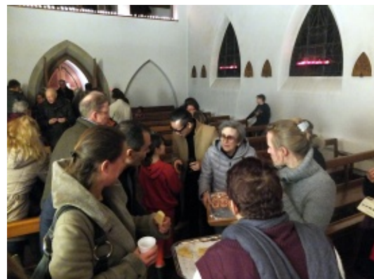
Notre incontournable verre de l'amitié