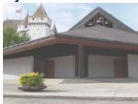
N.-D. de l'Immaculée Conception