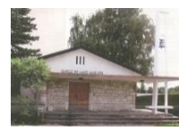
Ste Marie- Madeleine