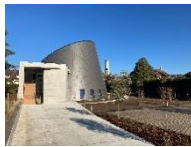
St Jean Baptiste