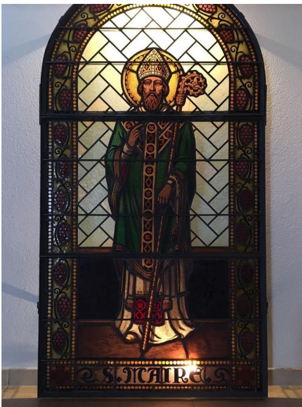
VETRATA DI SAN MARIUS A VILLAREPOS