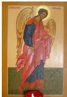
Icône de St-Michel