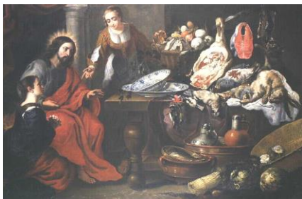
Groupe 'Réflexion-Partage' UP Orient