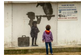
Groupe 'Réflexion-Partage UP Orient