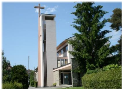
Paroisse du Bon Pasteur

Av. des Cerisiers 2 1008 Prilly +41 (0)21 634 92 14