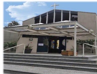
Paroisse de St-Joseph

Av. de Morges 66 1004 Lausanne +41 (0)21 624 45 55