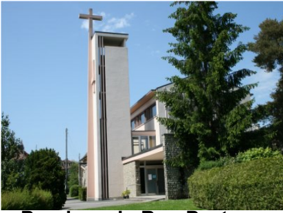
Paroisse du Bon Pasteur

Av. des Cerisiers 2 1008 Prilly +41 (0)21 634 92 14