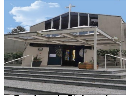
Paroisse de St-Joseph

Av. de Morges 66 1004 Lausanne +41 (0)21 624 45 55