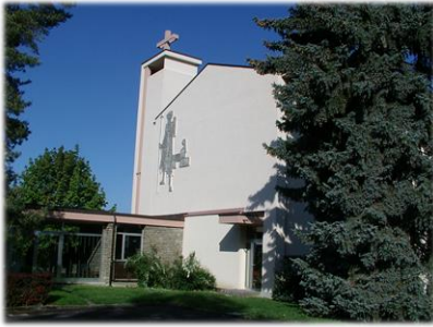
Paroisse du Bon Pasteur

av. des Cerisiers 2 1008 Prilly +41 (0)21 634 92 14