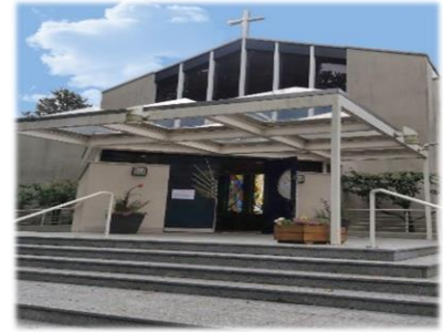
Paroisse de St-Joseph

av. de Morges 66 1004 Lausanne +41 (0)21 624 45 55