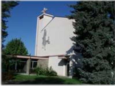
Paroisse du Bon Pasteur av. des Cerisiers 2 1008 Prilly +41 (0)21 634 92 14 paroisse.prilly@cath-vd.ch