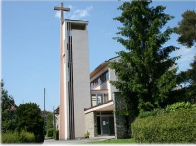
Paroisse du Bon Pasteur av. des Cerisiers 2 1008 Prilly +41 (0)21 634 92 14 paroisse.prilly@cath-vd.ch