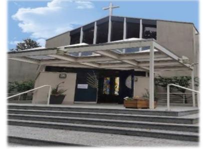
Paroisse de St-Joseph av. de Morges 66 1004 Lausanne +41 (0)21 624 45 55