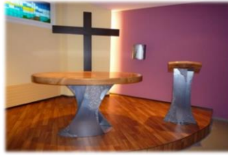
Foyer St-Nicolas sous le collège 1033 Cheseaux