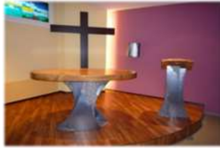
Foyer St-Nicolas sous le collège 1033 Cheseaux