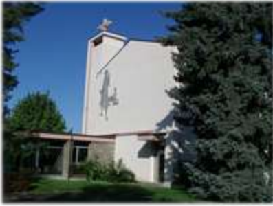
Paroisse du Bon Pasteur av. des Cerisiers 2 1008 Prilly +41 (0)21 634 92 14 paroisse.prilly@cath-vd.ch