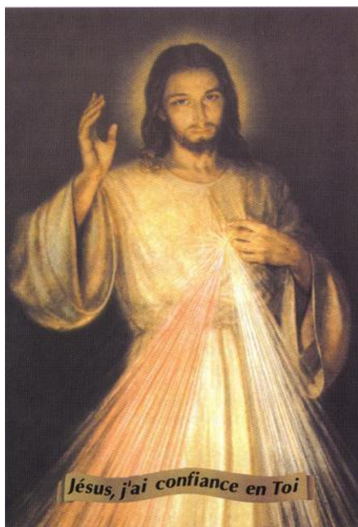
Tableau de Jésus miséricordieux

Le mois d'avril est dédié à Jésus Rédempteur