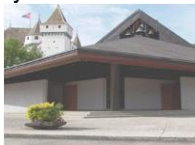
N.-D. de l'Immaculée C.