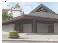
N.-D. de l'Immaculée C.