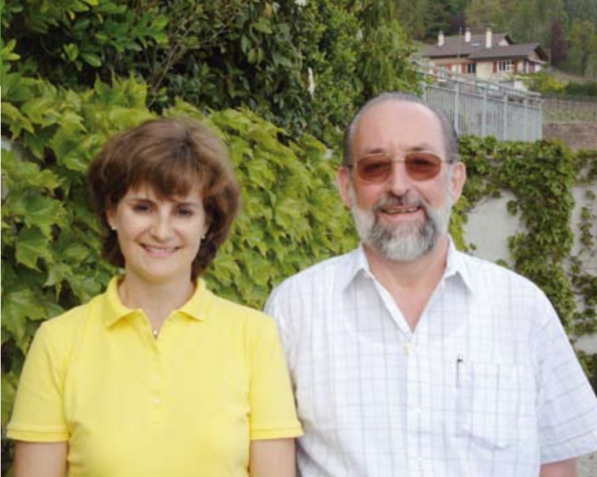
Les auteurs: un enthousiasme partagé et une belle complémentarité.