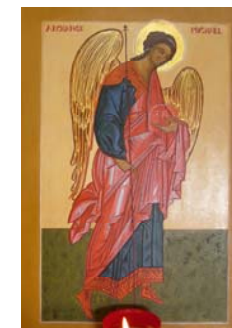
Icône de St-Michel

Si vous demeurez en moi, et que mes paroles demeurent en vous, demandez ce que vous voudrez, et cela vous sera accordé. Jean 15:7